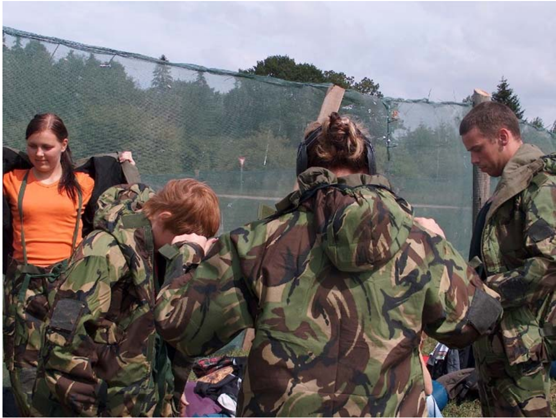
Jaunieši gatavojas paintbola spēlei. Kā ikvienā lietā – ir nepieciešams kārtīgs aprīkojums