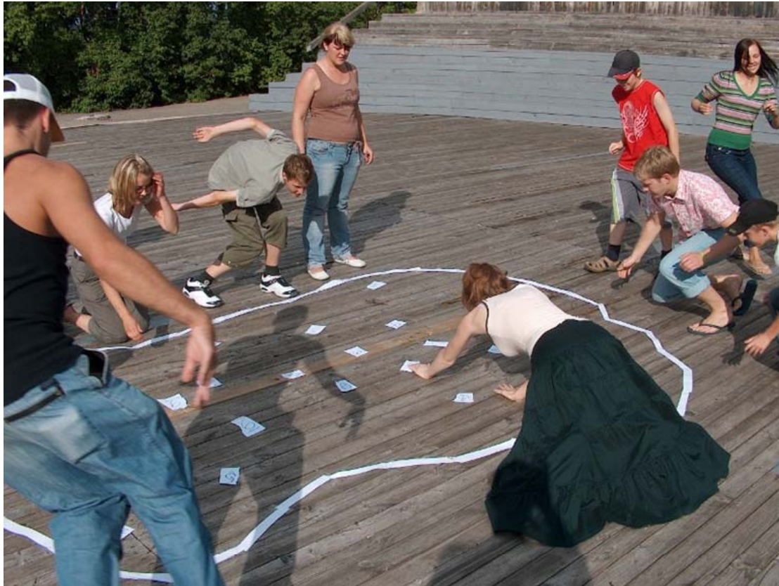
Aktivitate Atver sezamu un atbrīvo patvēruma meklētājus