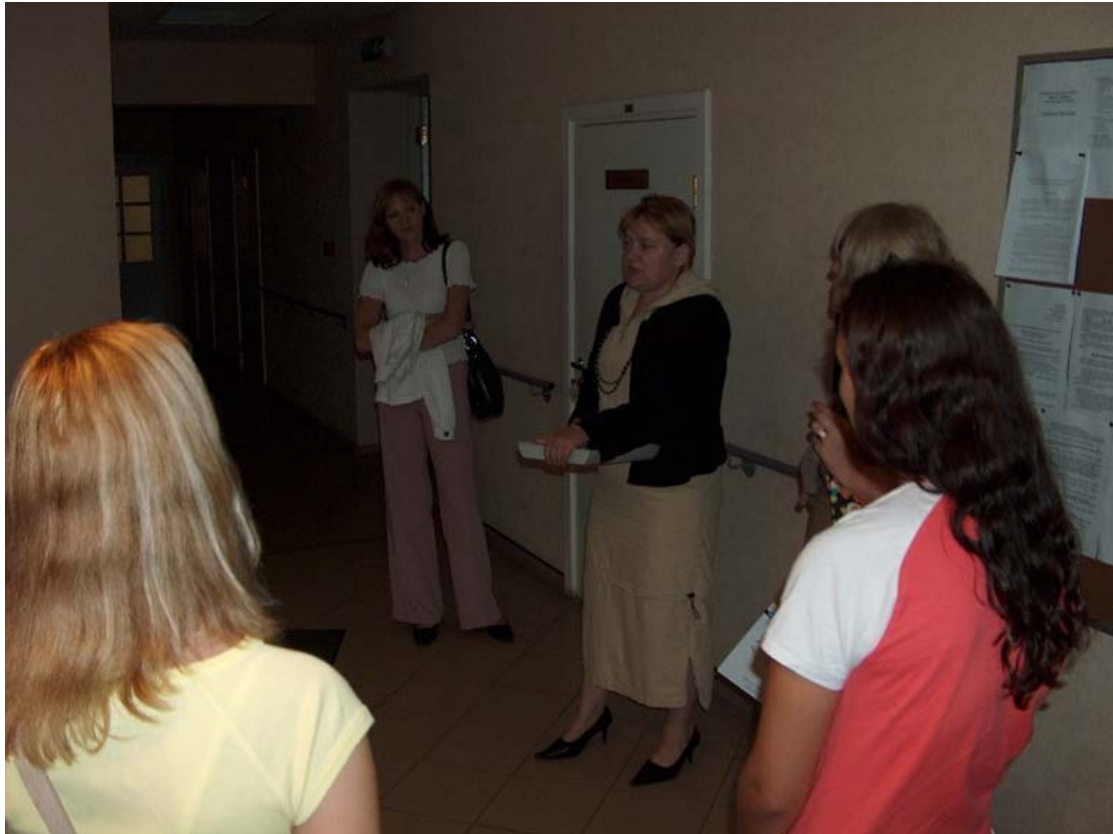
Patvēruma meklētāju izmitināšanas centrā „Mucinieki” jaunieši iepazīs ar centra darbību, tā funkcijām un sniegtajiem pakalpojumiem