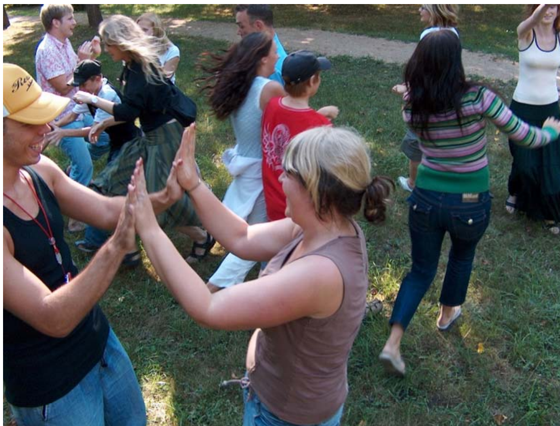
Aktivitāte Rūķītim nav māju

Komandas saliedēšanas aktivitātes deva iespēju pasākuma dalībniekiem labāk iepazīt vienu otru un izjust grupas kopējo dinamiku. Aktivitātes deva pozitīvu ieguldījumu turamākajā nometnes norisē.